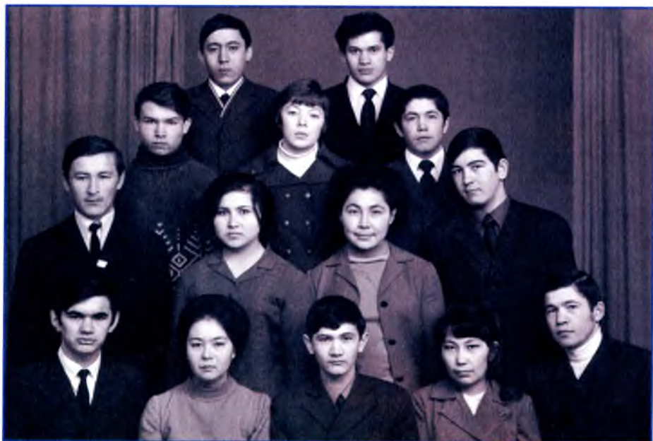
1972 й. Өфөлә укыусы Таймаç талиптары. Сәғит икенсе рәттә һулдан беренсе.