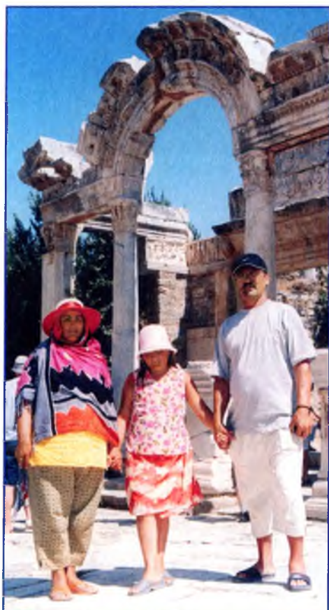
1999 й. Исмәғилевтар Тәркиәлә.