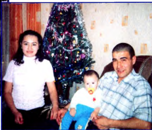
Замир катыны һәм балаһы менән.