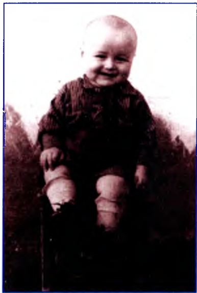
1954 й. Сәғиткә 1 йәш.