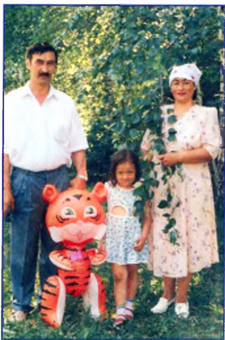
1996 й. Сәғит, Таңһылыу, Таңсулпан Өфәләге Якутов исемендәге паркта.