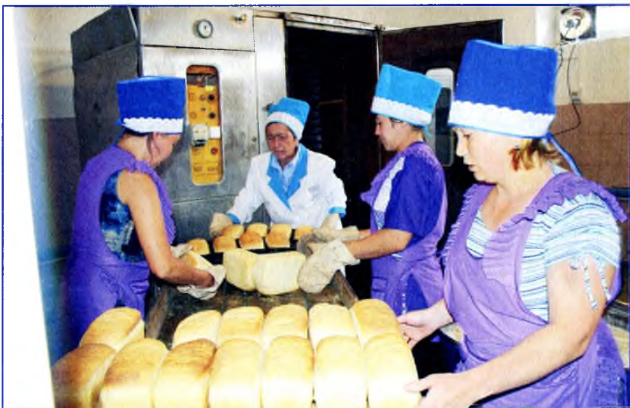
Таймастағы "Исмәғил" компанияһында икмәк беште.