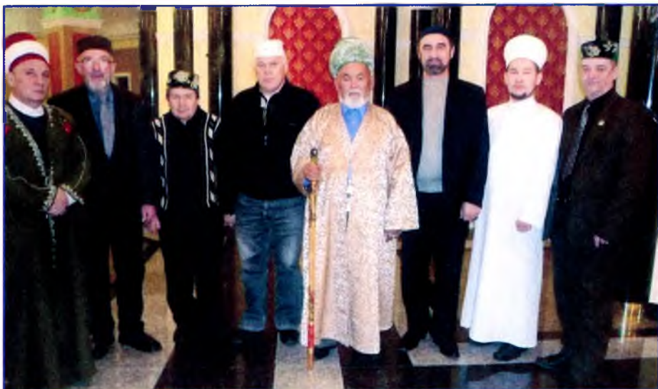
2006 й. Бойондорокһоз илдәр берлегенән Казанға сьезға килгән мөфтизәр араһында Сәғит хажи уңдан өсөнсө.