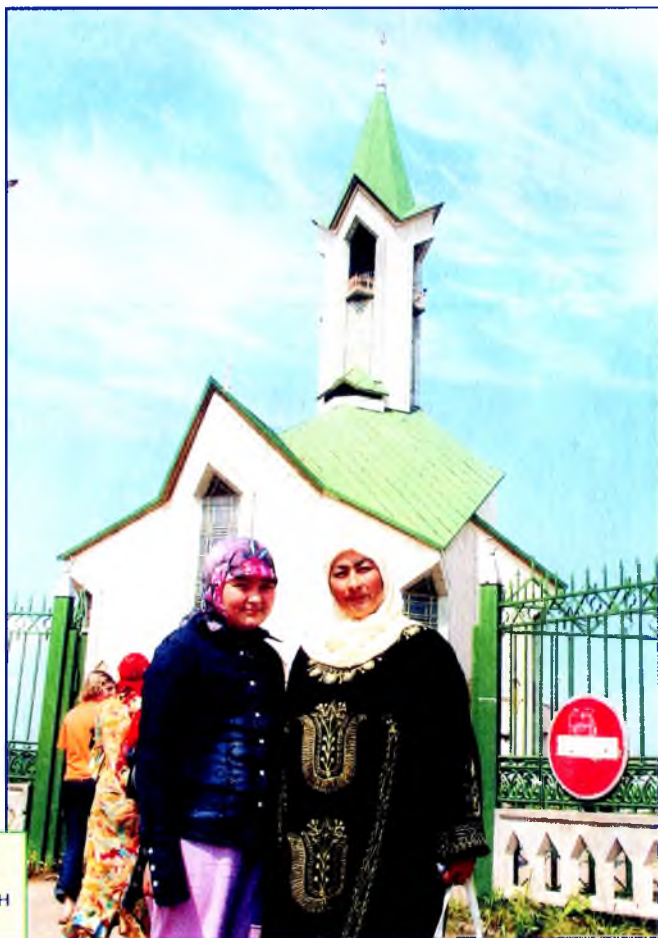
Таңһылыу менән Таңсулпан Өфөләге Хәмзә мәсетен асқан тантана мәлендә.