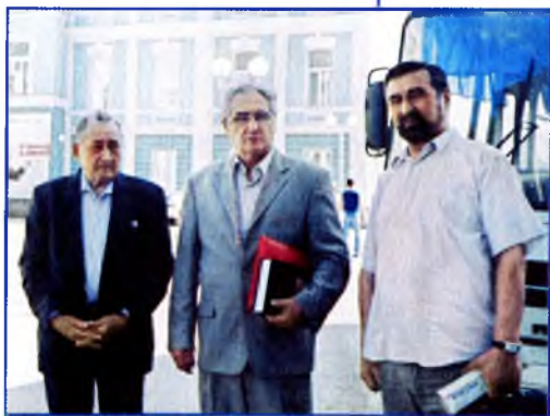
2007 й. Якташ академик М. Азнабаев (уртала) менән.