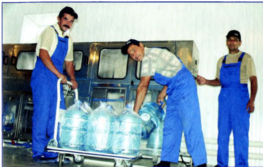
Таймаста "Гэлсэр" ныу кала кешелеренэ озатыр өсөн бына ошолай эзерленэ.