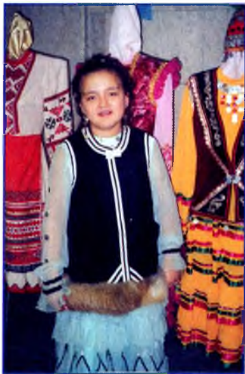
2003 й. Таңсулпан укыусы балалар бәйгеһендә башкорттоң озон көйн һырлап Гран-при алған көндә.