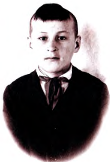
Сәғиткә 11 йәш.